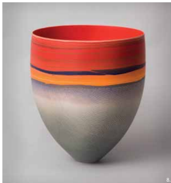
8 — Radiant Promise («Radieuse promesse») de/by Pippin Drysdale, AT, 2014